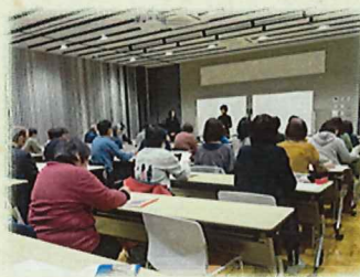
R5 ボールペン字講座の様子